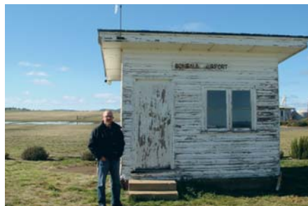
Vår projektledare står framför flygplatsterminalen i Bombala.

levererar förädlade trävaror såväl till den australiensiska marknaden som på export. Genom Tasco har Donghwa Timber sedan tidigare mycket god erfarenhet av HewSaw. I Tascos befintliga sågverk Sandy Lane används redan en såglinje från HewSaw av modell R200, installerad 1998.