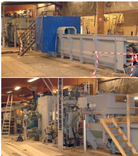
Interiörbilder från Krylbo under igångkörningen, där de små bilderna visar mättransportör och mätram samt rundvidare och själva sågmaaskinen. Den stora bilden visar bräddavskiljaren efter R200 PLUS.

Intresset för Krylbos enormt höga produktion är stort ute bland många sågverk i landet och vid förfrågan kan Veisto Sverige arrangera visning.