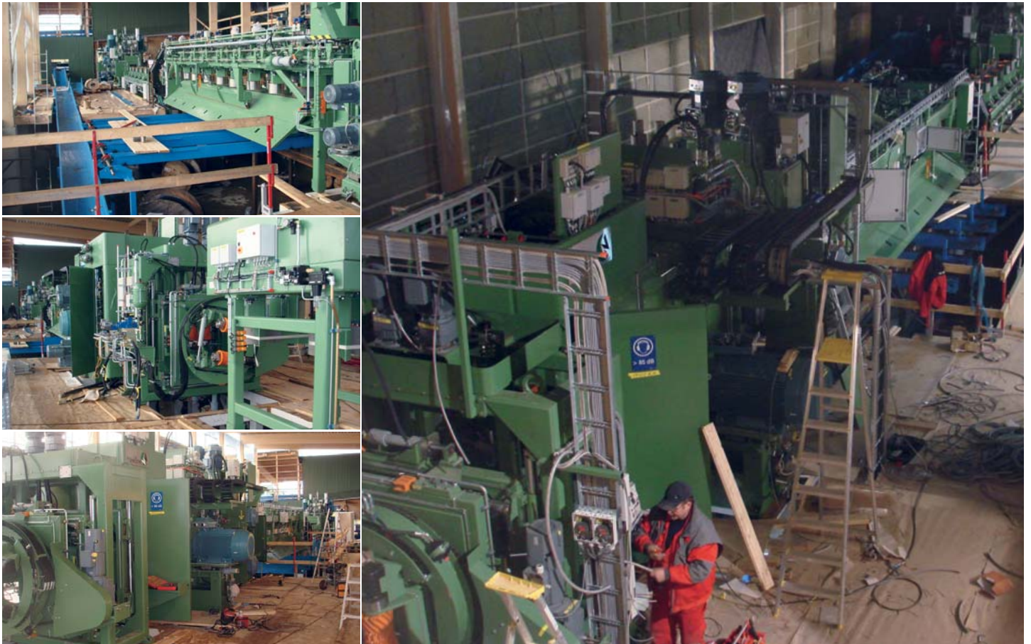
Interiörbilder från Sikås under monteringen i början på november.